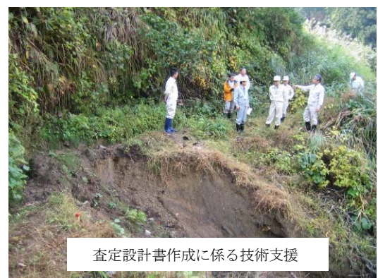
査定設計書作成に係る技術支援