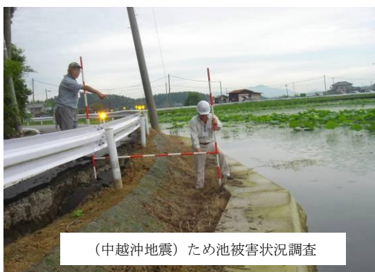
（中越沖地震）ため池被害状況調査