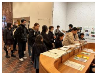
昨年も多くの方に ご来場いただきました